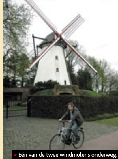
< Eén van de twee windmolens onderweg.

arme Kempense zandgrond vruchtbaar te maken. Het kanaal staat in verbinding met de Maas. Via die stroom zou kalkrijk water uit de Ardennen naar de Kempen gevoerd worden. Om er de akkers mee te bevoelen. Het plan mislukte grotendeels. Het zou wachten zijn op de kunstmest. Sindsdien – vanaf circa 1850 – werd de Kempengrond voetje voor voetje eindelijk vruchtbaarder. En hoe! De brede vallei van de Kleine Nete strekt zich voor ons uit als een wijds groen bijlaktak. Weiden en akkers wisselen elkaar af. Grote kudden koeien rukken aan mals-groen gras. De zandige akkerbodem is omgeploegd, bemest en ingezaaid. Hier hoeft je al lang niet meer tegen een wortel te praten om hem te laten groeien. In het ooit arme land is het vandaag goed boeren en heerlijk fietsen. Tientallen fietsers groetten we op deze rustige landwegels tussen Geel en Kasterlee. De eerlijke boerenstiel en het gezond genieten op de fiets