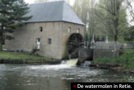
< De watermolen in Retie.

'Hoeve-ijs' wijst een pijl in de richting van de oprijlaan van de hoeve. Slechts weinig fietsers kunnen aan die verleiding weerstaan. Ik bestel een ijsje en vraag naar de smaak die op dit moment het meest gevraagd wordt. De ijsverkoopster moet geen seconde twijfelen. "Speculaasjes." Twee bolletjes, net genoeg voor de volgende etappe.