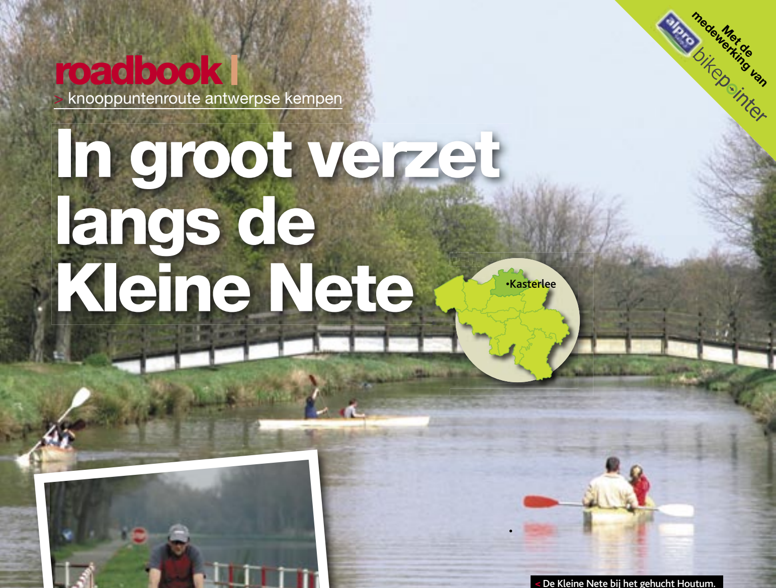
< De Kleine Nete bij het gehucht Houtum.