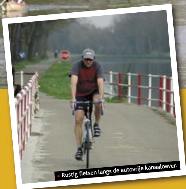
< Rustig fietsen langs de autovrije kanaaloever.