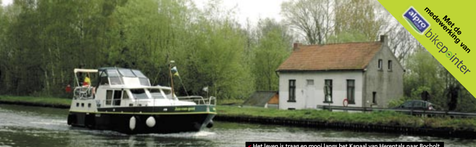
< Het leven is traag en mooi langs het Kanaal van Herentals naar Bocholt.