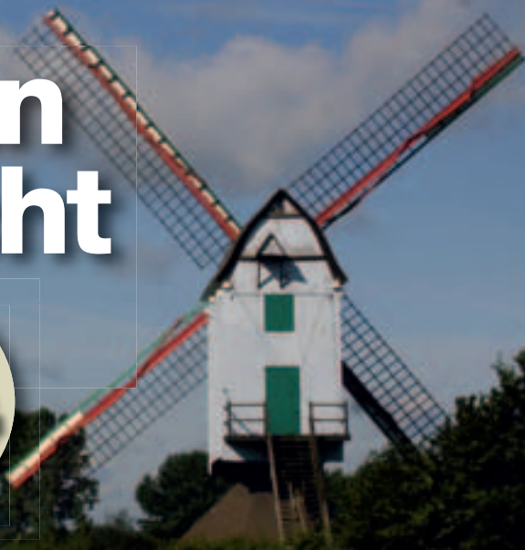
< Eén van de weinige windmolens in de streek.