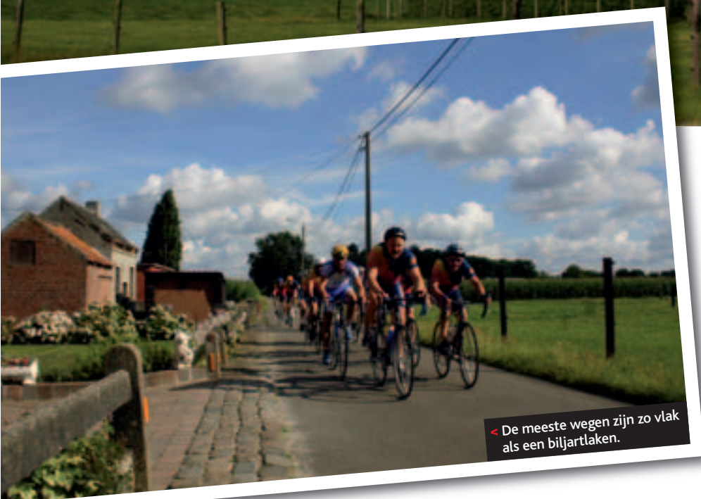
< De meeste wegen zijn zo vlak als een biljartlaken.