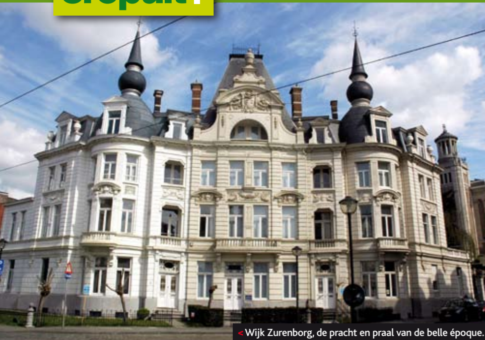
Wijk Zurenburg, de pracht en praal van de belle époque.

vliegtuigje dat neerstrijkt op de zakenluchthaven van Deurne. Via Mortsel, geen deelgemeente van Antwerpen maar een zelfstandige stad, brengt een ommetje langs de groene kasteeldomeinen Middelheim, Vogelenzang en Den Brandt ons bij het vertrekpunt. De Architectuurroute is veel meer dan de naam doet vermoeden. Al is architectuur het thema, het traject geeft een totaalbeeld van de stad. Je zou kunnen gewagen van een stadswandeling maar het is toch bovenal een fietstocht, een ontdekkingstocht die zorgvuldig uitgetekend is over prima fietspaden met duidelijke signalisatie en extra gevaarsbordjes of info over bezienswaardigheden waar nodig. Laat de racefiets gerust op stal, neem je tijd en laat alle indrukken op je afkomen. Een absolute aanrader.