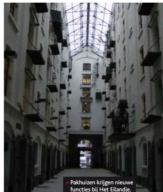
Pakhuizen krijgen nieuwe functies bij Het Eilandje.