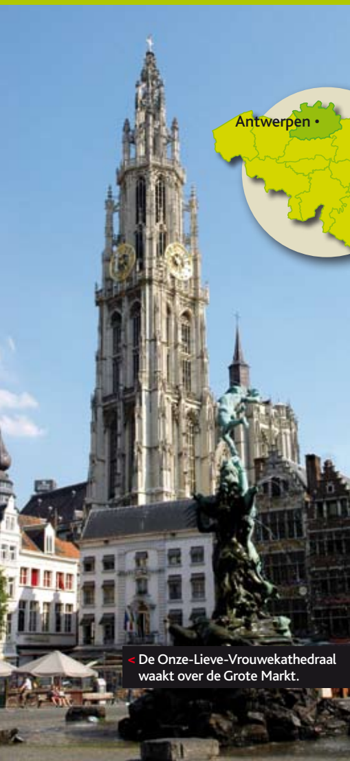
< De Onze-Lieve-Vrouwekathedraal waakt over de Grote Markt.