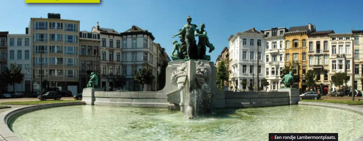
< Een rondje Lambermontplaats.