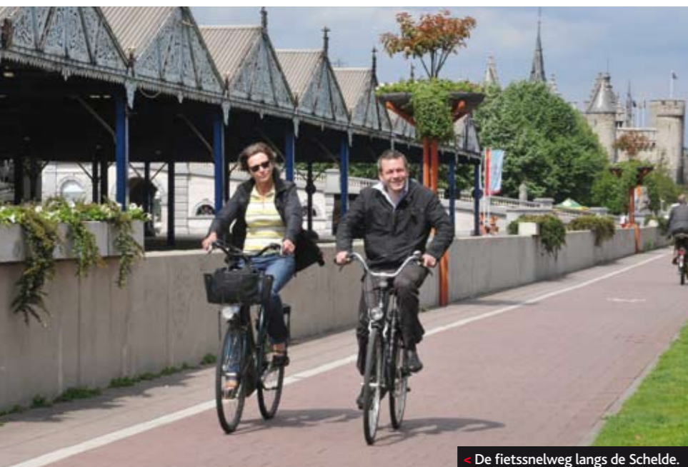
De fietssnelweg langs de Schelde.