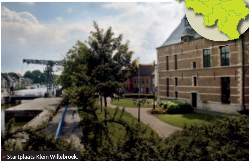
< Startplaats Klein Willebroek.

Wie de knooppuntenroute langs Ruppel, Dijle, Nete en Schelde aansnijdt, zal snel begrijpen waarom zoveel sportievelingen deze regio doorkruisen. Zuidelijk Antwerpen biedt namelijk een netwerk met honderden kilometers autovrije wegen en jaagpaden