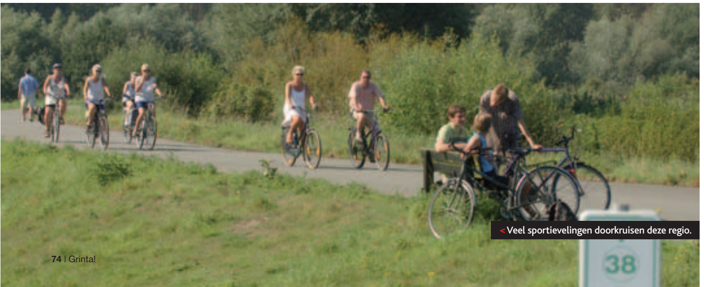
< Veel sportievelingen doorkruisen deze regio.

Het Scheldeland is vlakker dan Het Vlakke Land van Brel. Toch is de route aantrekkelijk voor elk soort fietser. Wie met de stadsfiets een daguitstap wil maken, geniet van de rust in een groene omgeving. De snelle sportfietser komt dan weer aan zijn trekken omdat hij soms kilometers lang nauwelijks verkeershinder treft. Wie achteraf terugblijkt op de gratis veerdiensten, de nieuwe fietsersbruggen en de schitterende jaagpaden die je onder de wielen krijgt, kan enkel maar besluiten dat fietsers hier echte luxepaardjes zijn.