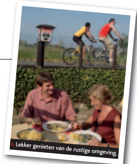
> Lekker genieten van de rustige omgeving.

dat bovendien de historische steden Lier en Mechelen met elkaar verbindt. Bovendien ligt deze streek pal in het midden van Vlaanderen. Ook wie vanuit Limburg of West-Vlaanderen afreist, zit er binnen anderhalf uur op de fiets.