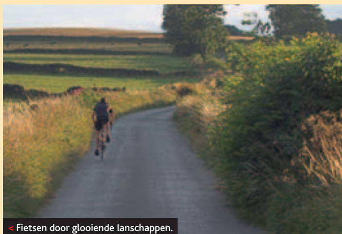
< Fietsen door glooiende landschappen.