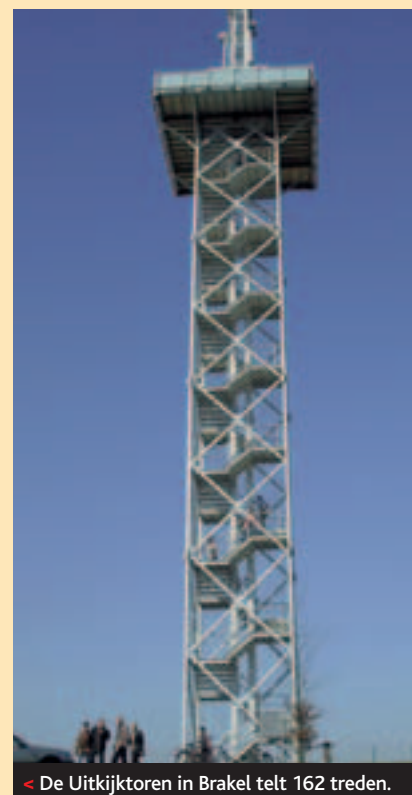
< De Uitkijktoren in Brakel telt 162 treden.