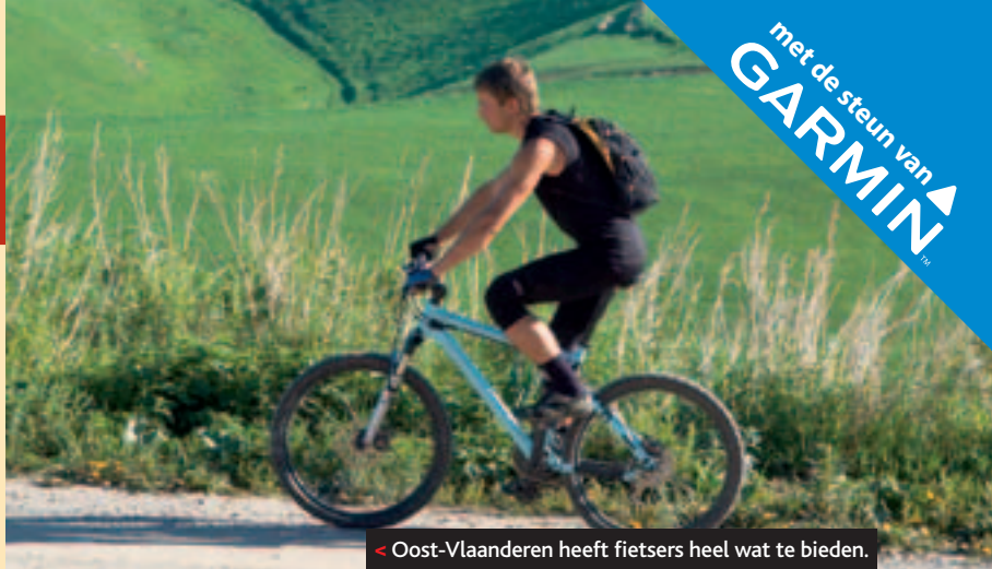
< Oost-Vlaanderen heeft fietsers heel wat te bieden.