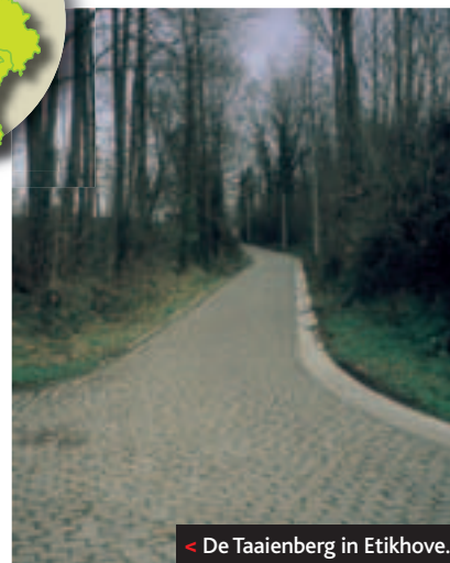
< De Taaienberg in Etikhove.

Grote Markt van Ronse. Vooraleer de voeten in de pedalen te klikken, kun je nog eerst een Bommelkie (een stukje cake met appelen en citroen) in je achterzak proppen. Met een Bommelsbiertje of een Ronsischen Tripel wacht je misschien beter tot na de rit.