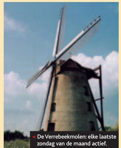
< De Verrebeekmolen: elke laatste zondag van de maand actief.

Via Louise-Marie – de gemeente dankt die naam aan de doortocht van de eerste koningin der Belgen – fietsen we richting Schorisse. Het Bosgat is een lastige kuitenbijter, maar de inspanningen worden al snel beloond met een prachtig vergezicht. Tegenwoordig schieten in de Vlaamse Ardennen de kleinschalige gastenverblijven als paddestoelen uit de grond en in Schorisse is dat niet anders. Grotere groepen kunnen terecht in de 19de eeuwse vierkantshoeve ‘t Bosgat, in het nabij-