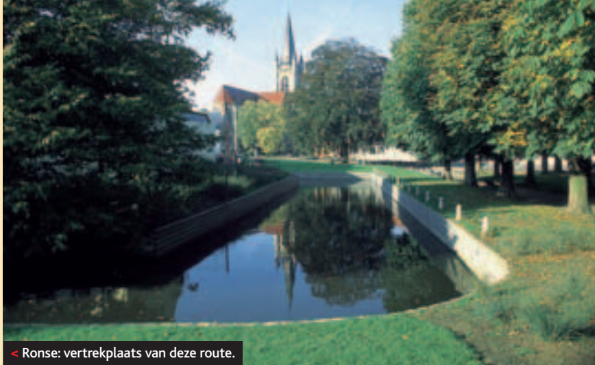
< Ronse: vertrekplaats van deze route.

het vizier. Tien jaar geleden kreeg de molen een opknopbeurt en elke laatste zondag van de maand is hij tussen 14 en 18 uur in bedrijf.